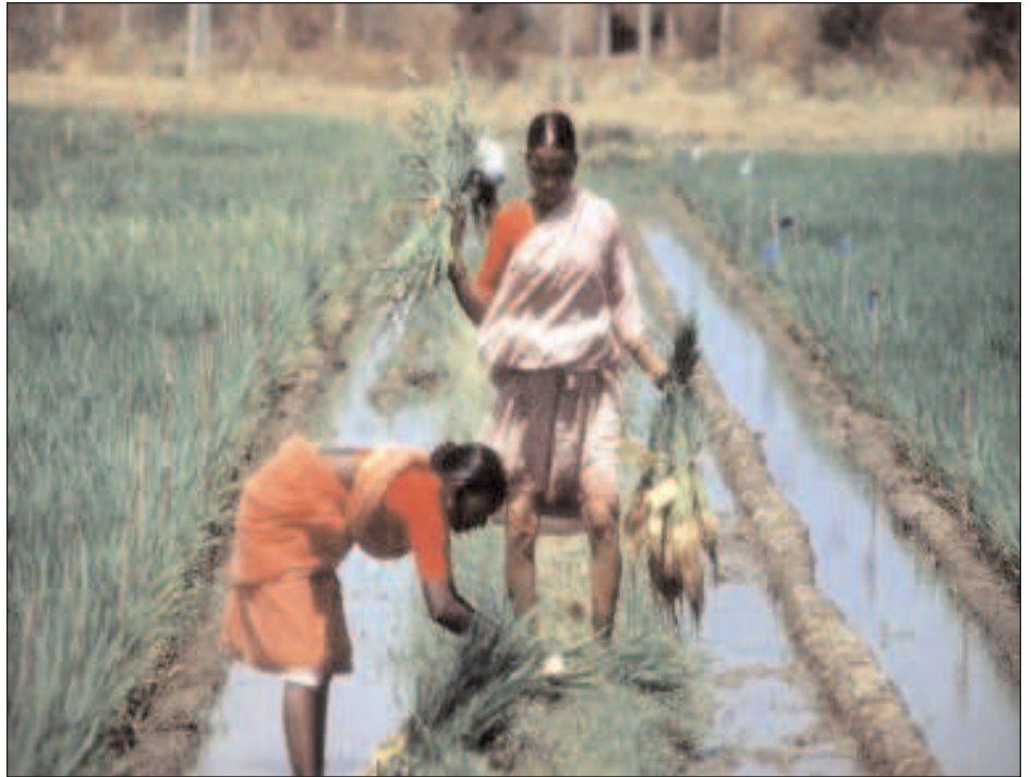
Cultivando arroz en la India

Esta bajada de tipos estimuló la siguiente burbuja: la inmobiliaria: la gente podía endeudarse y comprar propiedades inmuebles, cuya demanda creció. La subida de precios y la posibilidad de obtener fáciles ganancias hizo que el inmueble se convirtiera en una mercancía de inversión, así como el mismo crédito para adquirirlo (las hipotecas). Esta escalada de precios, además de perjudicar a las rentas más bajas, pervirtió el sistema económico induciéndole a construir más casas de las que se podían habitar, o a los bancos a ofrecer hipotecas a quien no podía pagarlas. En el momento en que la subida del