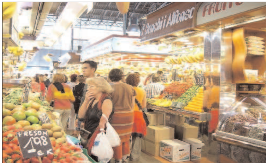
Compradores en el mercado de la Boquería en Barcelona

INFORMATIVO IMPRESO DE ATTAC MADRID. Nº 21. MAYO Y JUNIO 2008