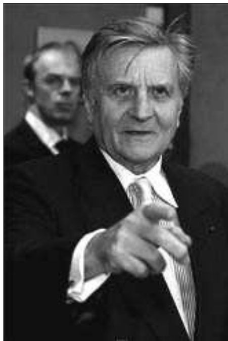
El presidente del Banco Central Europeo

En estas últimas semanas no he oído a ningún dirigente o personalidad de esa adscripción ideológica preguntarse sobre la necesidad, la legitimidad o el destino de los cientos de miles de millones de euros y dólares que los bancos centrales han puesto generosamente a disposición de los bancos, es decir, de los ya más