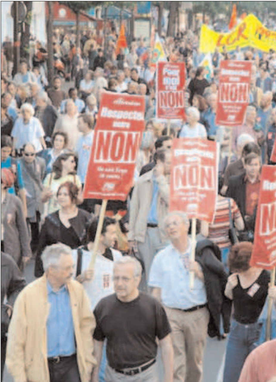
Manifestación contra la constitución europea en Francia

viene de la página anterior mismo tiempo que es la reunión de los ejecutivos nacionales. Los grupos de presión seguirán desempeñando un papel esencial, y los miembros de la Comisión no podrán ser elegidos o cesados por los parlamentarios. El derecho de iniciativa ciudadana queda en una declaración de intenciones no definidas. En cuanto al Banco Central Europeo (BCE), escapa a todo control democrático, y conserva como único objetivo la estabilidad de los precios, promovido al mismo rango que el resto de los objetivos de la Unión.