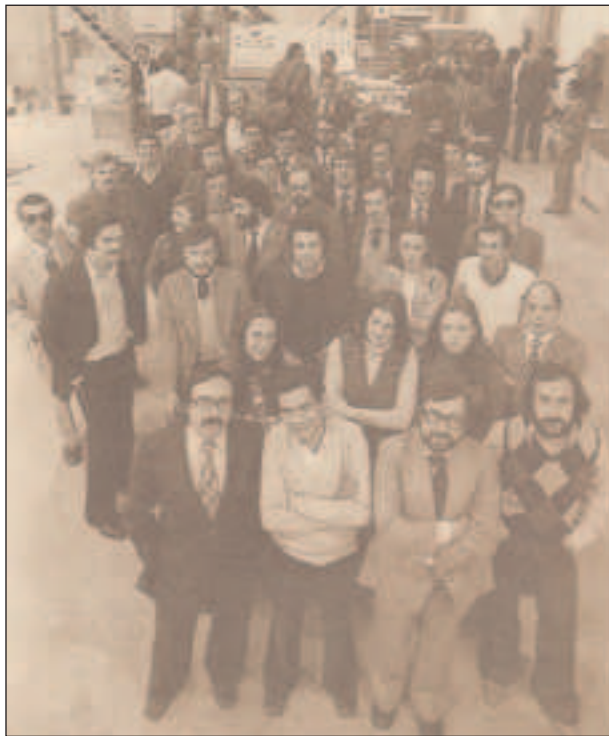
Primera redacción de El País

Toda regla tiene su excepción y esta traición a los lectores no supondrá la supervivencia ineludible del periódico. No soy el único que piensa así. Muchos han dejado de leerlo y para la derecha El País es un periódico maldito.