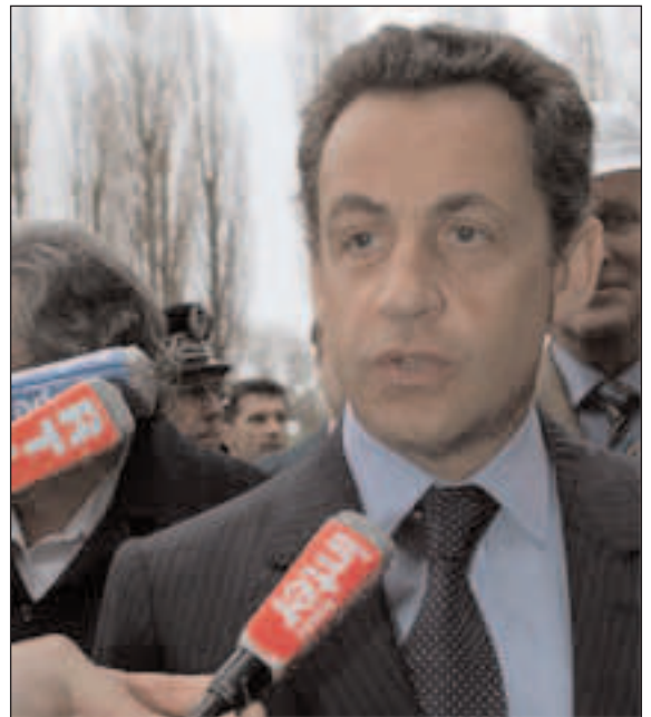
Solbes habla de “incertidumbre”

Pero, curiosamente, cuando se hacen este tipo de críticas, cuando se argumenta de este modo, no se tiene en cuenta que el Estado se gasta quizá mucho más dinero en subsidiar a los ricos, bien por activa