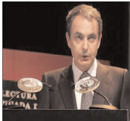
Zapatero lee el Quijote

La implantación del préstamo de pago en bibliotecas supone considerar a las bibliotecas como entidades comerciales y no como instituciones culturales necesarias para el desarrollo de los ciudadanos y el ejercicio del derecho a