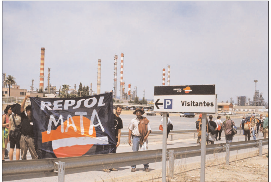
Protestas contra Repsol

Arauca ocasionan efectivamente desastres medioambientales asociados principalmente a los derrames de crudo y al uso desmedido de recursos naturales limitados, como es el caso del agua usada para la extracción, que termina contaminada y desechada en lagunas y corrientes cercanas a los campos. En algunos casos se acaba destruyendo los ecosistemas locales, como sucedió con la laguna de Lipa, resultado de las operaciones en Cravo Norte.