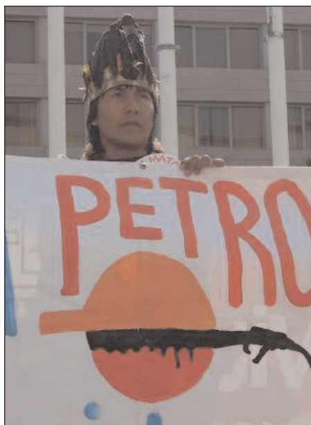
Protesta en Colombia contra Repsol

En ningún otro lugar es este hecho más llamativo que en Arauca, departamento petrolífero por excelencia, en el que se