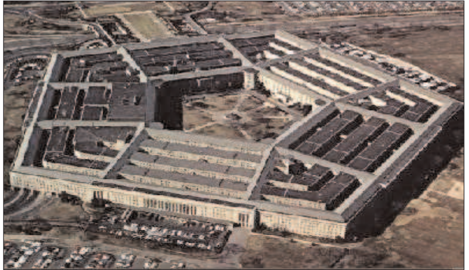
Fotografía desde arriba del pentágono

El grupo Carlyle es una de estas sociedades financieras y una de las más poderosas del momento. Las cifras indican que ninguna otra compañía de inversiones gestiona más dinero. Y es que el líquido con el que Carlyle cuenta para sus actividades es de casi 14.000 millones de dólares. Las inversiones del grupo Carlyle se extienden por todo el mundo. El desembarco en Europa de la sociedad fue espectacular. Llegó en el año 2001 con miles de millones de euros para invertir en los países más proclives a la política de Estados Unidos. Llama la atención su interés por sectores industriales estratégicos como el sector de los armamentos y la investigación. El Carlyle Group fue creado en 1987 y está dirigido por importantes figuras de la política internacional, ligados por la ideología conservadora: Frank C. Carlucci (ex-secretario de Defensa de Bush sr.), el