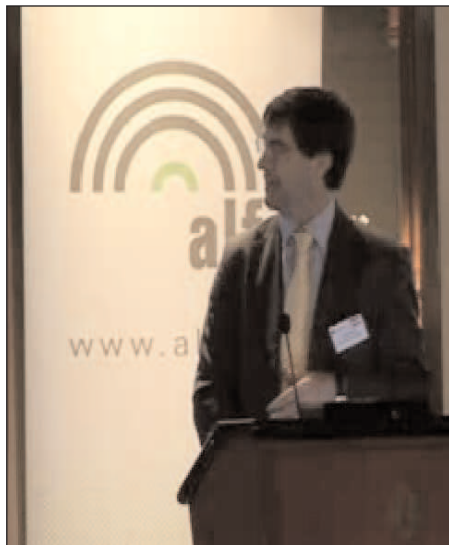
Durante la reunión en Madrid

Para denunciar en encuentro, un grupo de jóvenes universitarios miembros de ATTAC Madrid, disfrazados de trabajadores, empleados de banca y hasta de cacos; y armados con megáfonos, billetes falsos, folletos y buen humor, esperaron a las puertas del hotel a los elegantes dueños de las grandes fortunas nacionales. Querían recordarles que evadir impuestos es un delito, y que pagarlos es una obligación legal y moral. La iniciativa de ATTAC se enmarca dentro de su campaña Justicia Fiscal Global. No faltaron los gritos alusivos al gobierno capitalino -“Espe, Espe, Especuladores”-. Y es que la Cámara de Comercio de Madrid, un organismo de