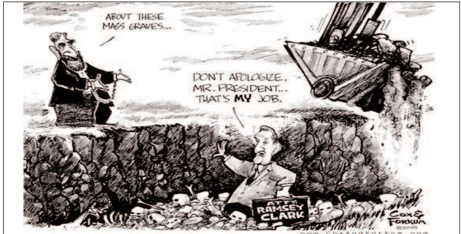
Ramsey Clark ridiculizado en la prensa estadounidense