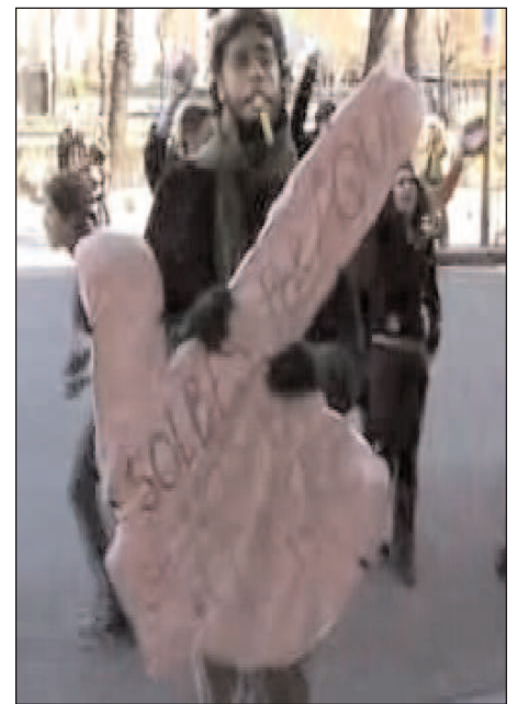
Jóvenes protestan por la reunión

Se puede visionar un video sobre la protesta callejera y escuchar una entrevista realizada a Attac en el programa Hoy por Hoy de la Cadena SER en el blogspot de Attac Madrid: ( http://www.attacma-