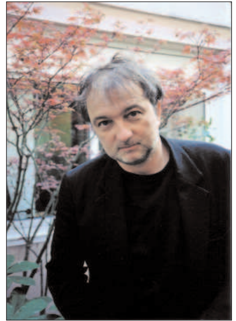
El autor del pol mico Revelations

La revelaci n de Robert supone dar respuesta a muchas preguntas de jueces, periodistas e investigadores sobre fondos supuestamente perdi-