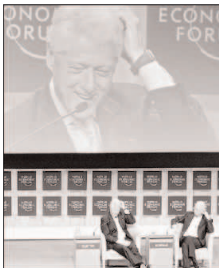
El ex presidente de los Estados Unidos, Bill Clinton, en el Foro de Davos

Este poder es posible porque los que lo poseen están consiguiendo que el dinero sea la medida de todas las cosas, que todo se mercantilice, que todo tenga un precio. Por ello pretenden que todos los bienes y servicios públicos de las sociedades se privaticen y se vean así sujetos a las leyes del mercado. Los países descapitalizados