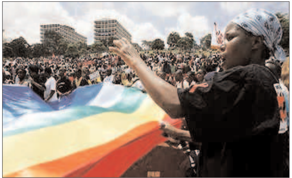
Manifestación durante la celebración del Foro Social Mundial