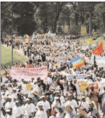
Marcha en Nairobi