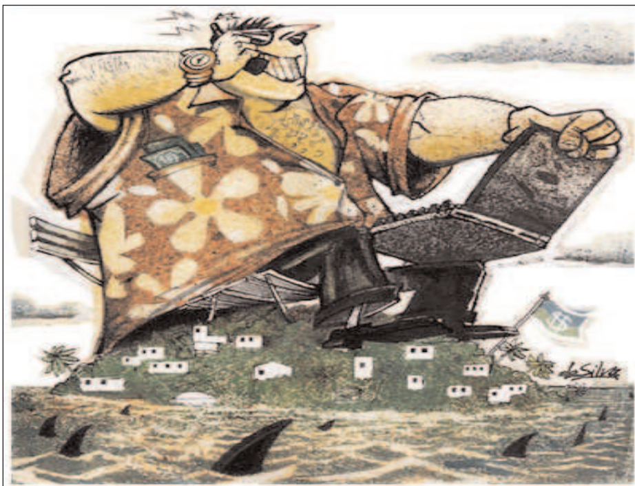
“Honrado” empresario haciendo uso de un paraíso fiscal

Un colectivo particularmente perjudicado son los jóvenes que, incluso en los países ricos, se enfrentan a grandes obstáculos para llevar a cabo su proyecto de vida dada su dificultad de acceder a un trabajo decente o a una vivienda digna.