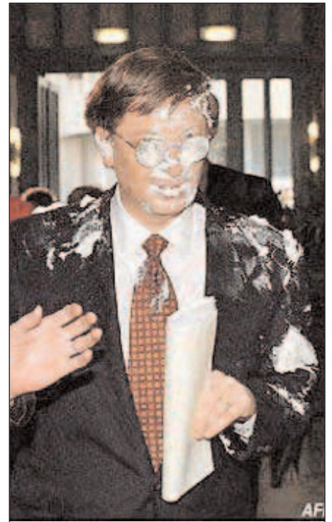
Bill Gates después de ser "atacado" por un activista que le lanzó una tarta en Bruselas

¿Merece una institución de estas características el Premio de Asturias de Cooperación? En La andadura pensamos que sí, ya que demuestra la verdadera cara de la solidaridad hoy en día: Una marca comercial bajo la que se vende cualquier