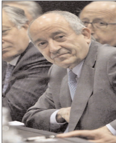
El Gobernador del Banco de España

Vale que defienda la libertad en los juegos de azar y de los casinos prohibidos en otro tiempo; pero resulta muy inquietante que un gobernador de Banco central defienda la libertad absoluta y el descontrol de los mercados financieros. Porque esa libertad financiera para jugarse los cuartos puede aceptarse para la ruleta, el póker y los casinos recreativos o de lujo,