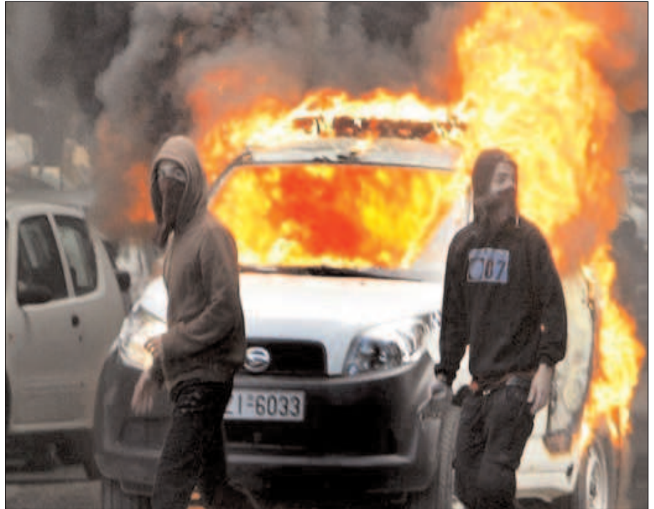
Protestas en Grecia

Pero aquí, en España, como en otros lugares del mundo, inmersos en la crisis económica producida por la tormenta financiera, muchas empresas entran en pérdida y otras hacen ganancia de pescadores a río revuelto, aligerando plantillas y poniéndose en las ventanillas del Estado a pedir ERES o subvenciones. En esta situación, el desempleo empieza a galopar, y en la carrera, los obreros autóctonos en paro regresan a ocupar los puestos de trabajo temporal dedicados en los años de