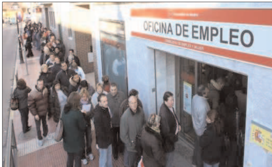
Cola del paro

INFORMATIVO IMPRESO DE ATTAC MADRID. Nº 25. ENERO-FEBRERO 2009